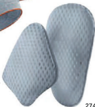
27420 INSERTO LUMBAR L1-L4